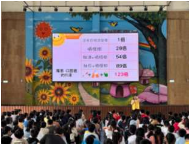
圖 1 社教專員進行菸檳防制宣導