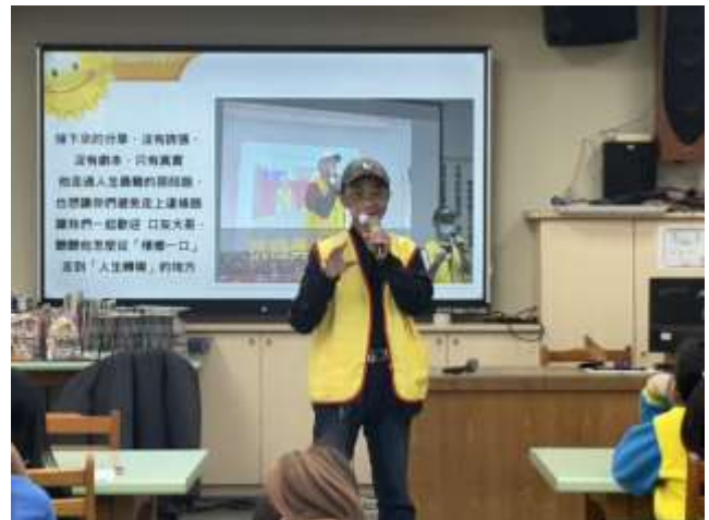
圖 2 口腔癌病友到校園現身說法